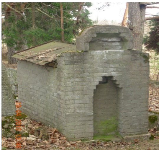
Ohels Varakļānu ebreju kapsētā, 2013.g. (K.Strods)

Vienā Varakļānu Ebreju kapsētas teritorijas daļā nav veikti apbedījumi, bet kapsētas tālākajā daļā (no ieejas) ir daudz apbedījumu. Kapakmeņi parasti ir izveidoti no granīta, smilšakmens vai betona. Simbolika un teksts uz kapakmeņiem var sniegt informāciju par mirušā piederību koenu vai levitu dzimtai, kā arī par mirušā nodarbošanos. Ebreju kapsētām nav raksturīga vienveidība, par to liecina kapakmeņu un piemiņas plāksņu dažādība. Piemēram, kapakmeņi Latgalē un Kurzemē atšķiras: Latgales ebrejiem kapsētās sastopama dekora vienkāršība, galvenā uzmanība ir veltīta uzrakstam. Šie uzraksti parasti ir jidišā un ivritā. Kurzemes ebreju kapsētās uz kapakmeņiem teksti parasti ir ivritā un vācu valodā. Uz kapakmeņiem bieži ir attēloti dzīvnieki: brieži, lāči, vilki, lauvas, jo tā pēc ebreju tradīcijas centās atveidot mirušā vārdu. Piemēram, čūska simbolizē nāvi, bet briedis – nevainību (Mellers, 2006, 137).