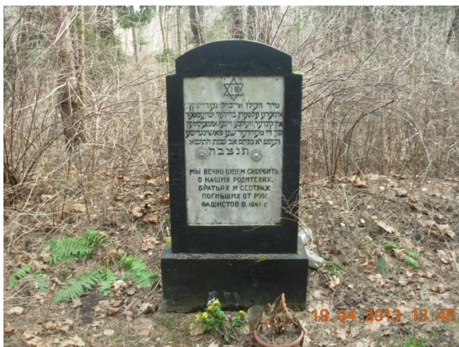
Holokausta piemineklis Varakļānu ebreju kapos, 2013.g.

Otrs piemineklis Holokaustā cietušajiem atrodas Ebreju kapu teritorijā, kur ir pārāpbedītas Holokaustā bojāgājušo ebreju mirstīgās atliekas. Pieminekli apkārt ieskauj metāla žogs.