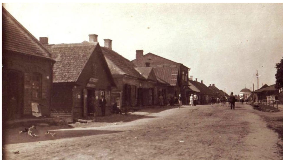
Varakļāni, Rīgas iela, dzīvojamās ēkas, 20. gs pirmā puse ( http://www.regionalistika.lv/lv/exposition/varaklani )

Kā liecina fotogrāfija, tad starp koka ēkām ir redzama arī kāda ķieģeļu ēka, kas pirms Otrā pasaules kara ir bijis samērā reti. Ebreju mājās raksturīga bija publisko telpu (veikala, darbnīcas) atdalīšana no privātajām – ģimenes apdzīvotajām – telpām. Šāds māju koncepts bija izplatīts vidusšķirā, kurā publiskā telpa asociējās ar ražošanu, tirdzniecību, pilsētas dzīvi, tāpat kā ar briesmām, bezpersoniskumu, patībai nepieņemamu. Ārēji mājas reprezentēja ģimenes sociālo statusu, tās morālās vērtības un īpašnieku gaumi. Iepriekš minētie elementi apliecina identitāti, kas kā cilvēka patības daļa atspoguļo mainīgās sociālās lomas un arī to dažādos statusus.