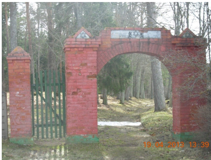
Varakļānu ebreju kapsētas ieejas vārti, 2013.g. (K. Strods)

Kapsētas ieeja ir veidota no sarkaniem ķieģeļiem, tai ir arkas forma ar divām kolonnām katrā malā. Virs centrālās ieejas uz arkas ir attēlotas divas lauvas, starp kurām atrodas Dāvida zvaigzne. Dāvida zvaigznes simbols 6 ir attēlots arī uz abiem ķieģeļu stabiem. Ieejas vārti ir veidoti no koka, tie ir zaļā krāsā.