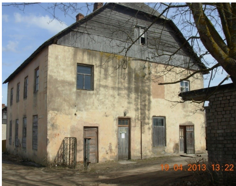
Baltā sinagoga, 2013. g.