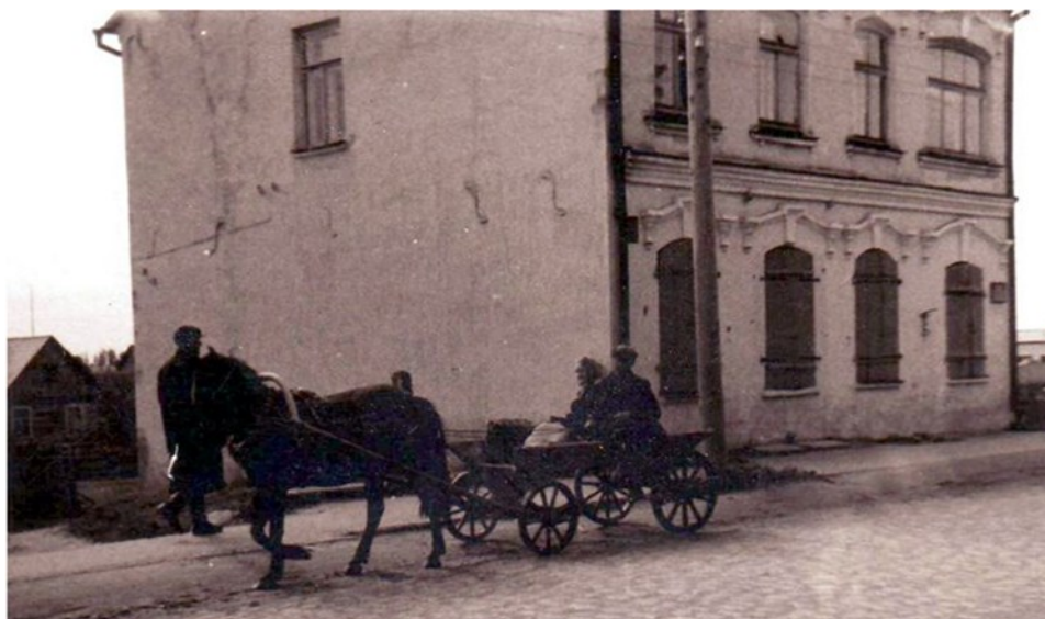
Kādreizējā ebreju dzīvojamā ēka