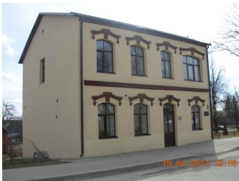
Kādreizējā ebreju dzīvojamā ēka, mūsdienās Varakļānu novada Sociālais dienests, 2013. g.

Tā kā ēka ir pietiekoši liela, tad tajā īsu brīdi bija izvietota Varakļānu poliklīnika. Mūsdienās ēka ir renovēta, un pašlaik to izmanto Varakļānu novada Sociālais dienests (Strods, 2013, KS 3).