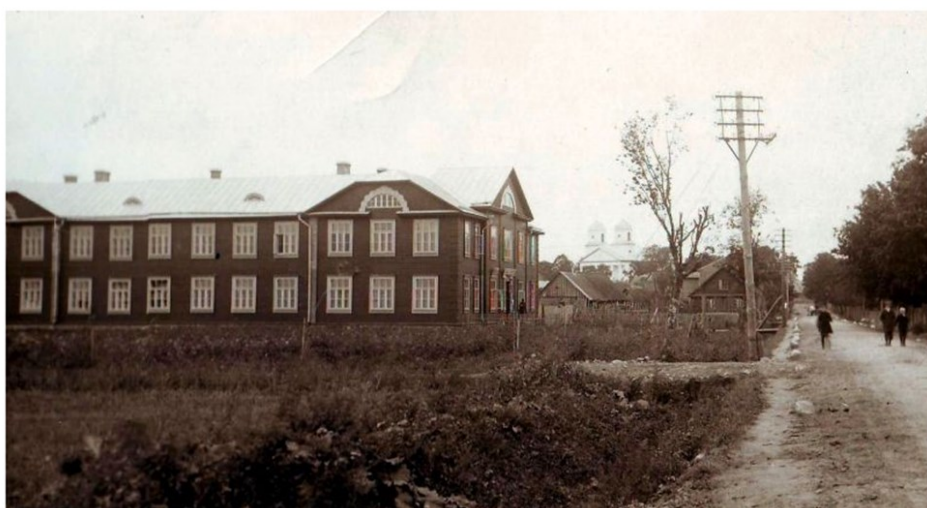
Jaunās ebreju sešgadīgās pamatskolas ēka, 20.gs. 30. gadi

Ebreju pamatskola ir bijusi liela izmēra divstāvu kokā ēka. Vairākās fotogrāfijas ir iemūžināts arī pamatskolas celtniecības process un skolas izskats pēc celtniecības darbu beigšanas. J. Staņko 1937. gada izveidotajā foto albumā „Rēzeknes apriņķa skolas” atrodams fotoattēls, kurā redzama gan Varakļānu Ebreju sešgadīgās pamatskolas skolotāju grupa, gan skolēni, gan arī pati Varakļānu Ebreju sešgadīgās pamatskolas ēka (Staņko, 1937, 45).