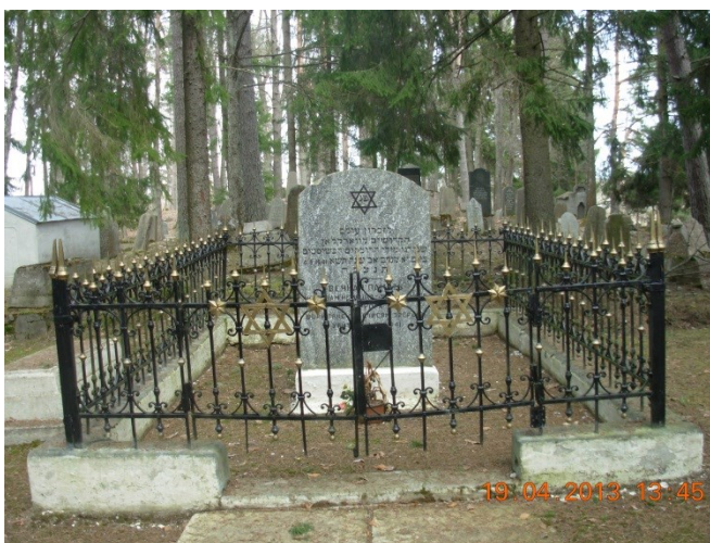
Holokausta piemineklis Varakļānu ebreju kapos, 2013.g. (K. Strods)

Otrs piemineklis Holokaustā cietušajiem atrodas Ebreju kapu teritorijā, kur ir pārāpbedītas Holokaustā bojāgājušo ebreju mirstīgās atliekas. Pieminekli apkārt ieskauj metāla žogs.