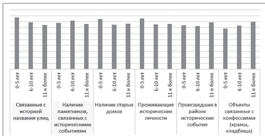
Рис. 2. Влияние фактора «продолжительность жизни в районе» на оценку характеристик урбанистической среды, связанных с историческими объектами

По всей видимости, это вызвано тем, что молодые люди активнее принимают участие в жизни урбанистической среды своего обитания, больше интересуются