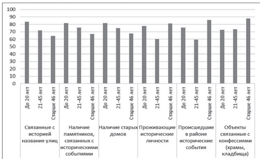
Рис. 4. Влияние фактора «возраст респондентов» на оценку характеристик урбанистической среды, связанных с историческими объектами

Вторая каноническая функция описывает отличие оценок своего района представителями района Погулянка от оценок своего района представителями районов Пурвциемс и форштадт.