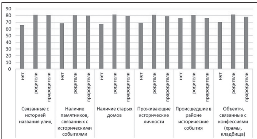
Рис. 3. Влияние фактора «наличие корней в районе» на оценку характеристик урбанистической среды, связанных с историческими объектами

историей и общественной жизнью, наконец, их знания об истории более свежи, так как они недавно окончили среднюю школу. Мы наблюдаем здесь эффект угасания, связанный с возрастом респондентов (см. рис. 4).