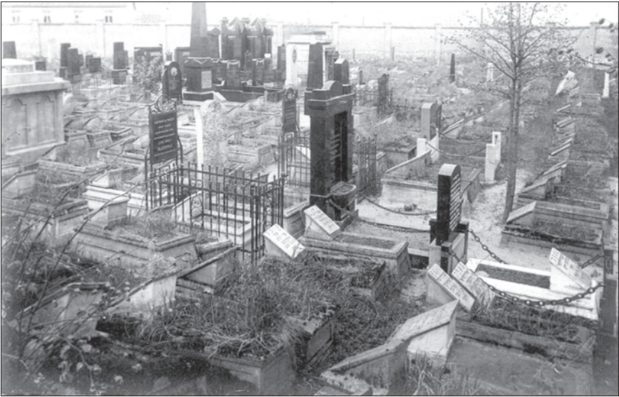
Старое еврейское кладбище в Риге

что дальнейшее расширение кладбища не было возможно. Для захоронения оно было закрыто в 1930 г. В 1928 г. было открыто Новое еврейское кладбище на Югле (имеется в виду кладбище Шмерли, ныне ул. Лизума, 4). С тех пор кладбище в Московском форштадте стали называть Старым еврейским кладбищем.