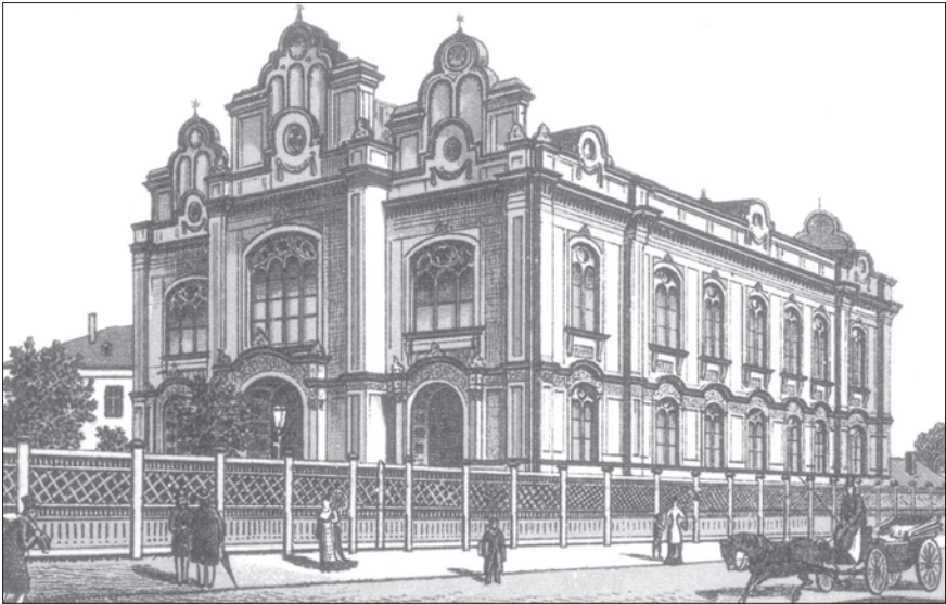
Рижская Большая синагога

ральным культовым зданием для всей еврейской общины Риги. Большую синагогу спроектировал лифляндский губернский архитектор Пауль фон Харденак (1819—1879).