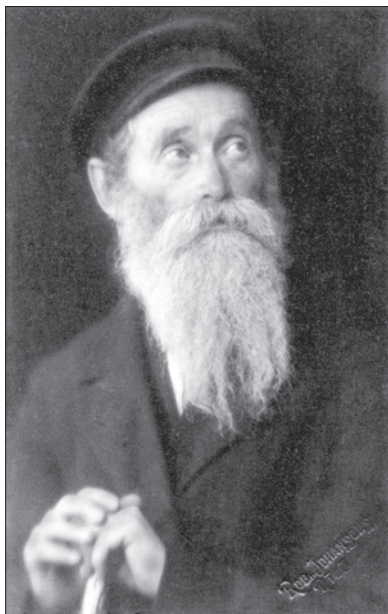
Рижский старый еврей

При советской власти руины синагоги были снесены и на ее месте был разбит сквер с установленной в нем Доской почета передовиков труда. После восстановления независимости Латвии здесь было создано памятное место в честь погибших евреев и их спасителей (с. 120).