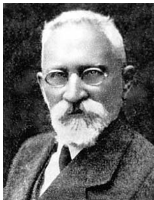
Семен Дубнов. Фото 30-х гг.

Дубинками и прикладами нас стали выгонять из машины и пристраивать к хвосту далеко растянувшейся плотной людской массы. <...> Из передних рядов доносились рыдания, переходящие в вопли и крики, сливаясь в сплошной стонущий гул. У многих на руках были дети. Ожидание близкой смерти передавалось и им, но дети не плакали — в детских глазах застыл леденящий душу страх. <...>