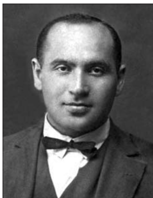
Соломон Антоколь. Фото 1929 г.