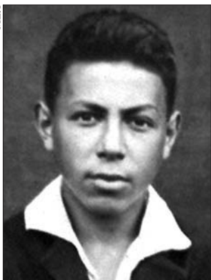
Мейлах Дамский. Фото 1924 г.