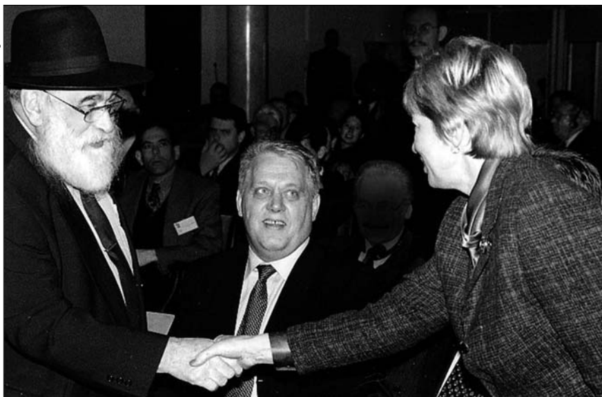
Главный раввин Риги и Латвии Н. Баркан и министр культуры Латвии К. Петерсоне; сидит президент министров Латвии А. Берзиньш