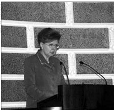
Президент Латвии проф. В. Вике-Фрейберга