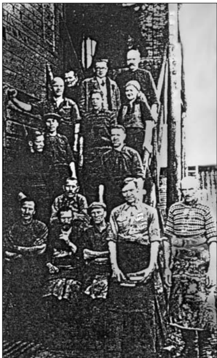
Работники кожевенного завода Миллера—Вестермана в Данкере (Глазманке) (начало 20-х гг.)