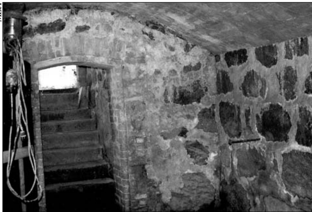
Погреб, в котором были убиты евреи Малты (современный вид). Изнутри через дверной проем видны тамбур и выход наружу