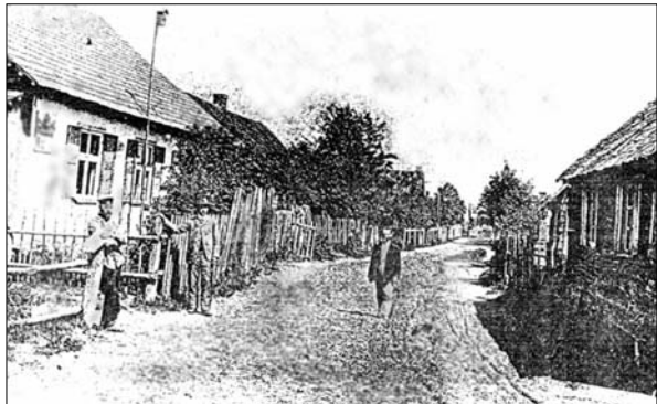
Улица в Данкере (Глазманке) (начало XX в.)

Все течения революционного движения проникали в Данкере из Двинска и Риги че-