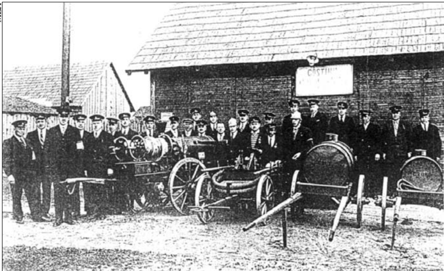
Пожарная команда в Данкере (Гостини) (30-е гг.)

В жизни евреев Латвии Гостини играли заметную роль: туда даже приезжали «высокие гости» — кандидаты в депутаты Сейма, а также претенденты на выборные места в еврейских организациях.