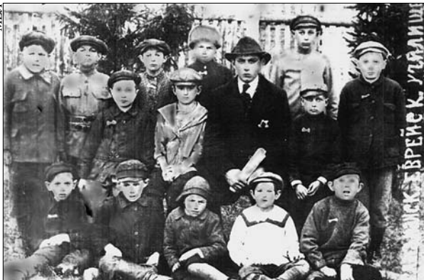
Еврейские школьники с учителем в Данкере (Глазманке) (1917 г.)

Единственное место, где бедный еврей мог немного заботиться, была синагога. Чем беднее был человек, тем он был набожнее. Своей *ишивы в местечке в то время еще не было, но были ученики литовских иешив, которых содержала местная еврейская община. Тогда это называлось «эси тес» — «дни едь». Для каждой еврейской семьи был назначен день, когда она кормила ученика ие-