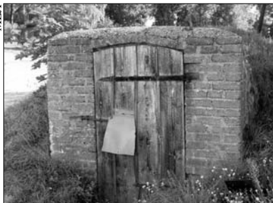
Вход в погреб, где были убиты евреи Малты (современный вид)

сентября 1941 г. схема: 10—15 человек ставятся лицом к яме и выделяются по два стрелка на каждого — как это было потом в Анчупанских холмах 133?