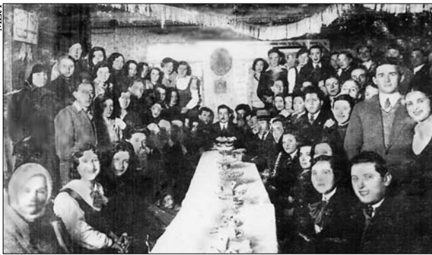
Проводы еврейской молодежи, отъезжающей в Палестину (Данкере (Глазманка), конец 20-х — начало 30-х гг.)

числе 504 еврея 71 . Улиц в городке было уже более полутора десятков, но главной по-прежнему оставалась Большая улица. В 1937 г. из-за неосторожного обращения с огнем сгорела одна сторона этой улицы (обращенная к реке). Сгорели главным образом деревянные дома евреев. Каменные дома и церковь огонь не осилил.