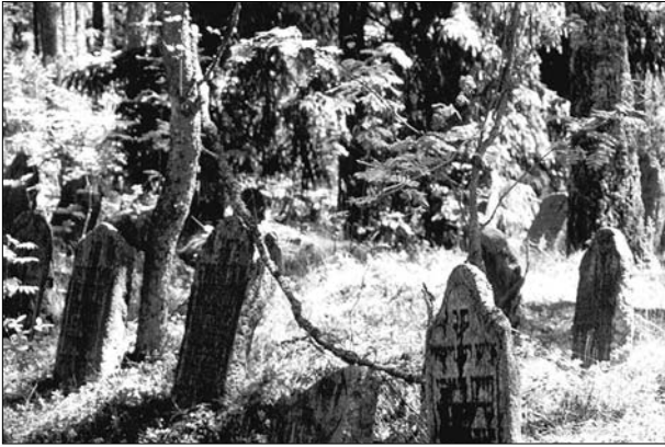
Старое еврейское кладбище Данкере (Глазманки, Гостини), находящееся в 1,5 км влево от дороги Плявиняс—Мадона, за виадуком через железную дорогу