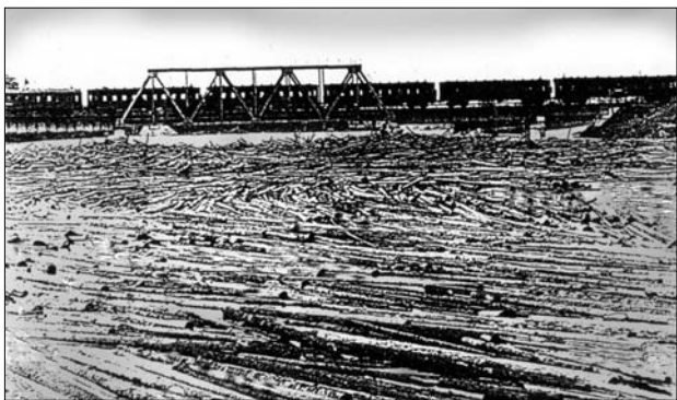
Вид на железнодорожный мост через реку Айвиексте у Данкере (Глазманки) во время лесосплава (20—30-е гг.)

В городке процветала и общественно-политическая жизнь. Помимо упоминавшегося выше Бунда в