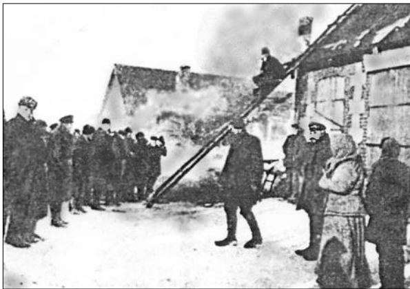
Сожжение Данкере (Глазманки) царской карательной экспедицией (12 января 1906 г.)