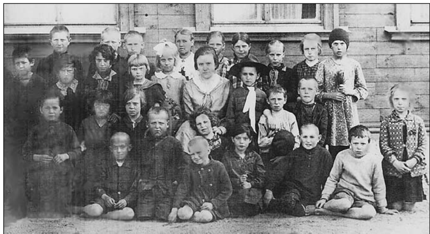
Учащиеся 2—3-го классов основной школы в Боровке с учительницей. 1932 г. Среди них было пять еврейских детей