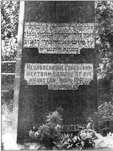
Памятный камень, установленный в 1957 г. на месте расстрела евреев Боровки (Силене). Надпись на камне: «Незабвенным еврейским жертвам, павшим от рук нацистов. Июль 1941 г. в Боровке»

и в Илукстском уезде, куда входило Силене, отметил, что местные «самоохранщики» 48 при уничтожении евреев совершенно утратили человеческий облик (“...durch die Liquidierung der jüdischen Einwohnerschaft physisch und in Disziplin ausser Rand und Band gekommen...”) 49 .