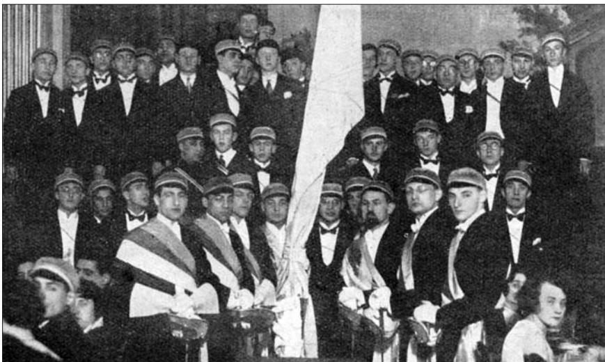
Торжественное вручение знамени от рижской «Хасмонеи» тартуской «Хасмонее» по случаю ее 5-летия