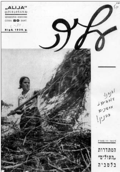
Журнала «Алия». Рига, 1939 г. Обложка